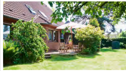
10 Wohngemeinschaft Tannenhofstraße 12 22848 Norderstedt