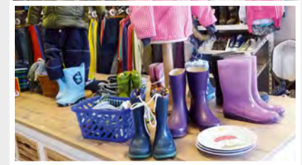
15 Kinderkaufhaus Ran & gut! Hamburger Straße 66 24568 Kaltenkirchen