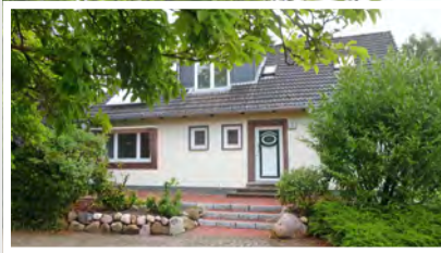
9 Wohngemeinschaft Rudolf-Kinau-Straße 9 25451 Quickborn