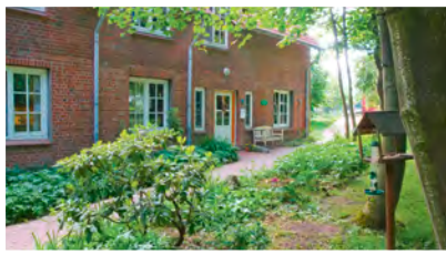
7 Wohnen am Kattendorfer Hof Dorfstraße 2, 24568 Kattendorf