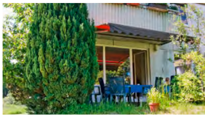
6 Apartmenthaus Heidelweg 7, 22844 Norderstedt