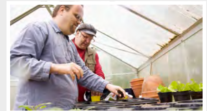
17 Arbeiten am Gräflingsberg Wilstedter Straße 136 f 24558 Henstedt-Ulzburg