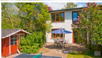
8 Wohnen am Gräflingsberg Wilstedter Straße 136 f 24558 Henstedt-Ulzburg