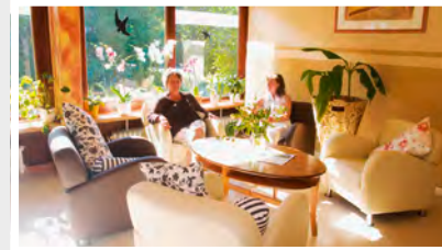
12 Kulturtreff Rhen Wilstedter Straße 136 h 24558 Henstedt-Ulzburg