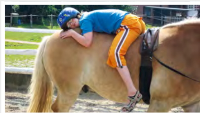
11 Ferien auf dem Kattendorfer Hof Dorfstraße 2, 24568 Kattendorf