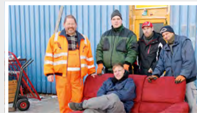
14 Kaufhaus Ran & gut! Kaltenkirchener Straße 14 24629 Kisdorf