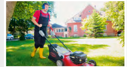
16 Arbeiten in Kattendorf Dorfstraße 2, 24568 Kattendorf