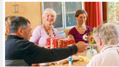
13 Kultur Kattendorf Dorfstraße 2, 24568 Kattendorf