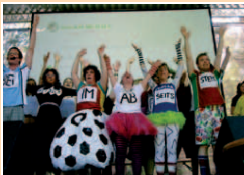
Theater- gruppe Klabauter

1. bis 5. Juli „Provokationen des Glücks“