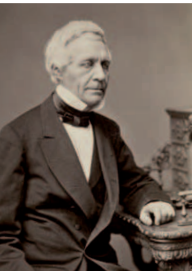
Wichern am Schreibtisch

Am 22. September 1848 hielt er auf dem ersten Kirchentag in Wittenberg seine berühmte Stegreifrede. Mit dem zentralen Satz „Die Liebe gehört mir wie der Glaube!“ rief er die evangelische Kirche auf, sich ihrer sozialen Verantwortung bewusst zu werden. Er erreichte damit die Gründung des „Centralausschusses für die Innere Mission“.