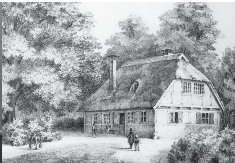
Das alte Rauhe Haus

Am 12. September 1833 rief er mit großem Erfolg die Hamburger Bürger in einer öffentlichen Versammlung auf, ihn bei der Gründung des Rauhen Hauses in Horn zu unterstützen. Noch im Herbst bezog er mit Mutter, zwei Geschwistern und zwölf Jungen Das Rauhe Haus in Hamburg-Horn. Das Rettungshaus wuchs zu einem Rettungsdorf an.