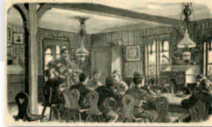
Familien- zimmer im Haus Bienenkorb

1832 nach Hamburg zurückgekehrt, wurde er Erziehungsgehilfe an der Sonntagsschule Pastor Rautenbergs in St. Georg und lernte im dortigen Besuchsverein die erbärmlichen Lebensverhältnisse insbesondere der Kinder kennen. In ihm reifte der Entschluss, für sie ein Rettungshaus zu gründen.