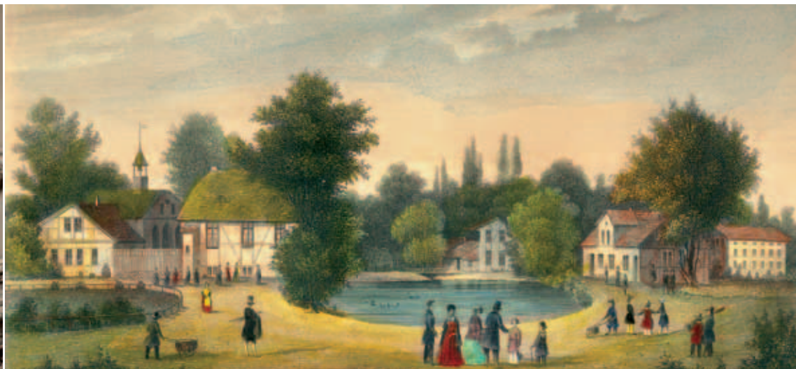
Das Stiftungsgelände im Jahr 1842