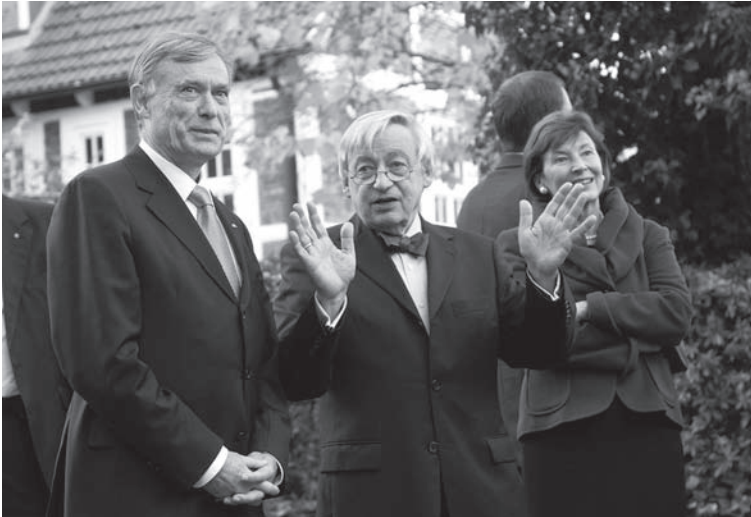
Rundgang auf dem Gelände des Rauhen Hauses

Ende Oktober 2008 besuchten der Bundespräsident und seine Frau das Rauhe Haus. Anlass war das Wichern-Jahr zum 200. Geburtstag des Diakonie-Begründers und das 175-jährige Jubiläum des Rauhen Hauses.