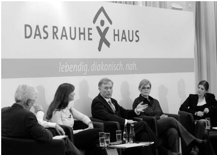
Diskussionsrunde mit Horst Köhler

Am Rande der Veranstaltung hatten einige Studierende ein Banner an der Hochschule befestigt: „Grenzenlose Solidarität statt beschränktem Nationalismus“. Sie spielten damit auf Köhlers frühere Tätigkeit beim Internationalen Währungsfonds an.