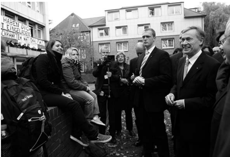
Studentisches Banner an der Hochschule „Wir haben dich nicht eingeladen“